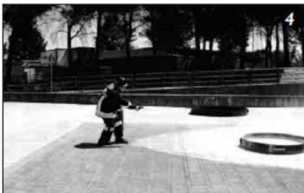
Foto 4 Focolare estinto. Si nota la traccia a forma conica lasciata dall'effetto ventaglio operato nella fase di estinzione.