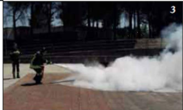
Foto 3 Si dirige sul fuoco spargendo la polvere alla base delle fiamme a ventaglio, al fine di coprire l'intera superficie interessata.

Foto 2 Inizia l'erogazione dell'estinguente posizionandosi sopravvento.