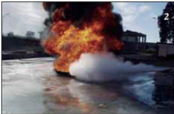
Foto 2 Inizia l'erogazione dell'estinguente posizionandosi sopravvento.

Foto 3 Si dirige sul fuoco spargendo la polvere alla base delle fiamme a ventaglio, al fine di coprire l'intera superficie interessata.