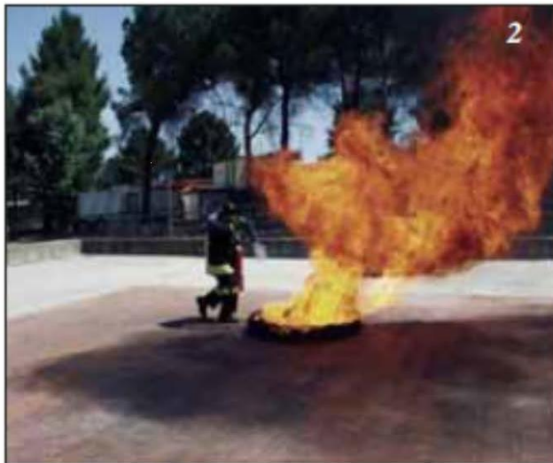
Foto 2 Si dirige sul fuoco sopravvento, come si evince dalla direzione delle fiamme ed aziona l'estintore.

Foto 3 Sparge in modo circolare il gas sul focolare eliminando la possibilità per il combustibile di ossigenarsi, quindi ottiene l'estinzione.