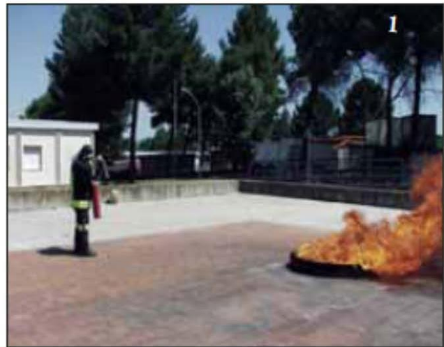
Foto 1 L'operatore impugna l'estintore e si prepara all'attacco del fuoco.