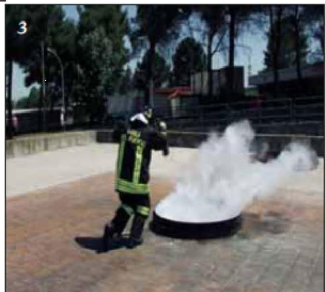
Foto 3 Sparge in modo circolare il gas sul focolare eliminando la possibilità per il combustibile di ossigenarsi, quindi ottiene l'estinzione.

Foto 2 Si dirige sul fuoco sopravvento, come si evince dalla direzione delle fiamme ed aziona l'estintore.