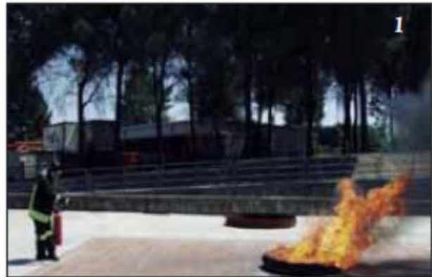
Foto 1 L'operatore è pronto per attaccare il fuoco con un estintore a polvere.